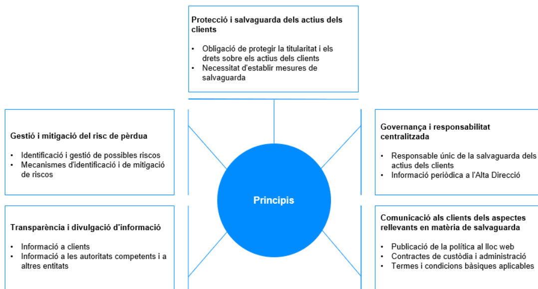
Figura 1. Principis per a la salvaguarda d'instruments financers

Els principis generals que han de regir la salvaguarda d'instruments financers són els següents: