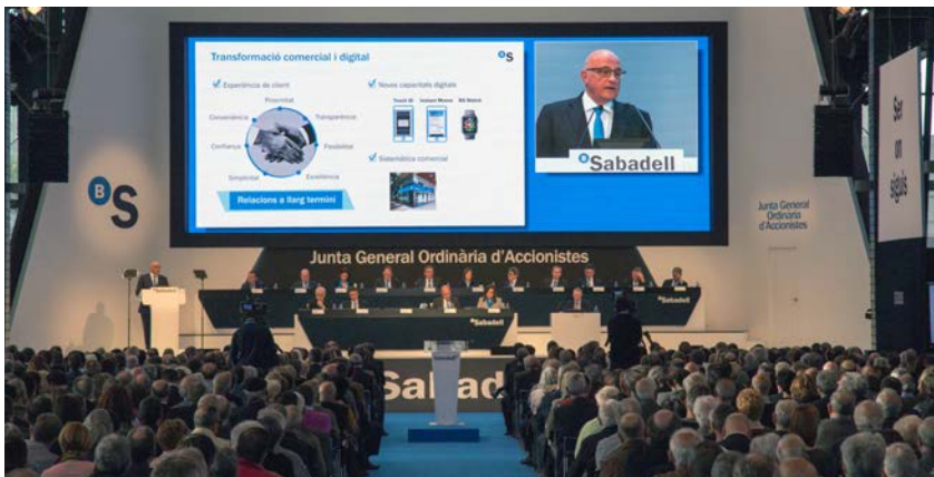
Imatge de la Junta que es va fer a la Fira de Sabadell.

La Junta General d'Accionistes de Banc Sabadell, celebrada el 31 de març passat a Sabadell, va aprovar majoritàriament la gestió i els resultats de 2015 i va donar la conformitat a la proposta de distribució dels 708,4 milions d'euros de beneficis, obtinguts en tancar l'exercici passat. D'aquesta manera, es va acordar destinar prop de 272 milions d'euros a la retribució a l'accionista en la modalitat de scrip dividend o retribució flexible, juntament amb la remuneració complementària per l'equivalent a 0,02 euros per acció.