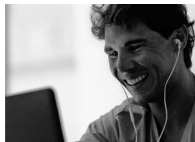
Rafa Nadal, en la campanya “A prop”.

Banc Sabadell i Solvia han aconseguit tres guardons en els XVII Premis a l’Eficàcia de la Publicitat, que anualment convoca l’Associació Espanyola d’Anunciantes (AEA). Durant la gala que es va celebrar el 29 d’octubre passat al Teatro Real de Madrid, Banc Sabadell va aconseguir dos ors, màxim reconeixement del certamen, per la seva campanya “A prop” en les categories d’eficàcia en comunicació comercial i en estratègia més innovadora. També Solvia va veure reconeguda la seva campanya publicitària amb una plata en la categoria d’eficàcia en comunicació comercial. En els últims cinc anys, les campanyes publicitàries desenvolupades per Banc Sabadell i Solvia han aconseguit més de 90 premis.