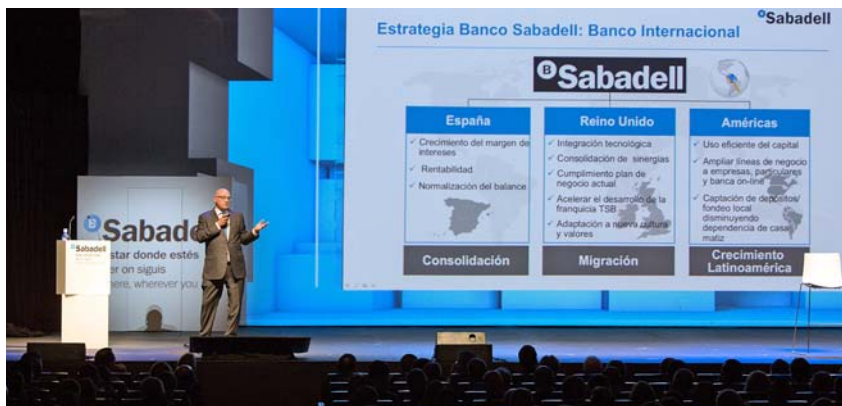
Una imatge de la Reunió Anual de Directius que va tenir lloc el desembre passat a Barcelona.