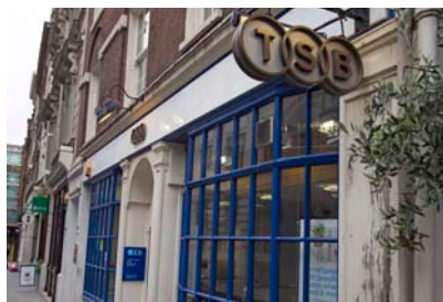
Oficina de TSB a Londres.

El novembre passat, TSB va adquirir a Northern Rock, entitat intervinguda pel Banc d’Anglaterra el 2007, una cartera d’hipoteques de 3.300 milions de lliures (4.468 milions d’euros). Aquesta operació, que suposa incorporar un flux de 34.000 clients, forma part de l’estratègia de la filial anglesa de Banc Sabadell de créixer en el mercat britànic. El període mitjà d’amortització d’aquests préstecs és d’uns 10