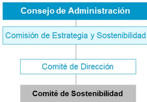
Figura 4. Estructura de Gobierno

Es el órgano encargado del establecimiento y el impulso del Plan de Sostenibilidad y de la monitorización de su ejecución, así como de la definición y divulgación de los principios generales de actuación en materia de Sostenibilidad y del impulso del desarrollo de proyectos e iniciativas relacionados, tanto nacionales como internacionales. Reporta periódicamente al Comité de Dirección y a la Comisión de Estrategia y Sostenibilidad sobre el avance del Plan y sus iniciativas. Es responsable de supervisar e impulsar el sistema de gestión ambiental del Banco.