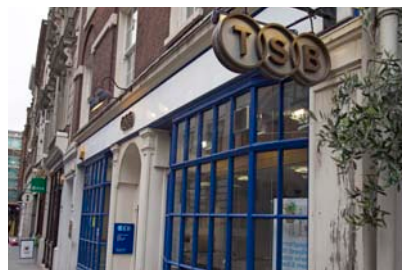
Oficina de TSB en Londres.

El pasado noviembre, TSB adquirió a Northern Rock, entidad intervenida por el Banco de Inglaterra en 2007, una cartera de hipotecas de 3.300 millones de libras (4.468 millones de euros). Esta operación, que supone incorporar un flujo de 34.000 clientes, forma parte de la estrategia de la filial inglesa de Banco Sabadell de crecer en el mercado británico. El período medio de amortización de estos préstamos