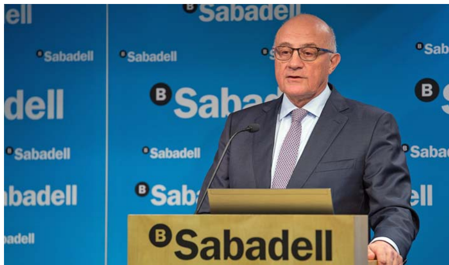
El presidente Josep Oliu, en un momento de su comparecencia ante los medios de comunicación.