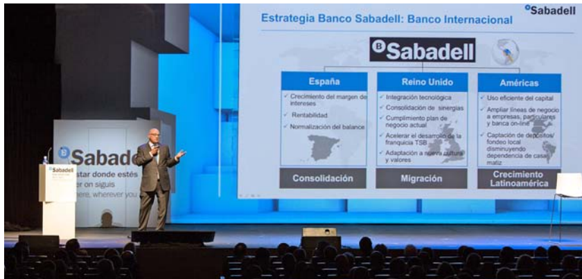
Una imagen de la Reunión Anual de Directivos que tuvo lugar el pasado diciembre en Barcelona.

Banco Sabadell congregó el pasado mes de diciembre en Barcelona a más de 600 ejecutivos en su Reunión Anual de Directivos, evento en el que se dió cuenta de los resultados alcanzados este año y las perspectivas de negocio de 2016. El presidente Josep Oliu incidió en que “para nosotros, el año 2015 ha sido excelente en la gestión de los ingresos, no sólo por el margen o las comisiones, sino también por los ingresos financieros”. En este sentido, añadió que “los resultados han sido crecientes y en la senda de lo previsto, con avances muy notables en el saneamiento del balance, 3.000 millones este año”. A su vez, Oliu resaltó como hitos esenciales la adquisición del banco