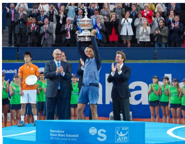
Nadal alza el trofeo entre el presidente Josep Oliu y Javier Godó.

Para la entidad, esta ha sido la novena edición como patrocinador principal de uno de los torneos estelares de la categoría ATP 500. Un evento de estas características atrae medio millar de periodistas y alcanza una audiencia mundial que supera los 30 millones de personas.