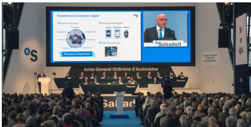
Imagen de la Junta que se celebró en la Fira de Sabadell.

La Junta General de Accionistas de Banco Sabadell, celebrada el pasado 31 de marzo en Sabadell, aprobó mayoritariamente la gestión y los resultados de 2015 y dio así mismo la conformidad a la propuesta de distribución de los 708,4 millones de euros de beneficios, obtenidos al cierre del pasado ejercicio. De este modo, se acordó destinar cerca de 272 millones de euros a la retribución al accionista en la modalidad de scrip dividend o retribución flexible, así como la entrega de la remuneración complementaria por el equivalente a 0,02 euros por acción.