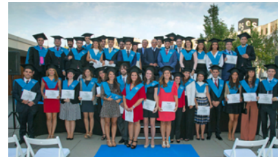
Els graduats del Talent Graduate Program.

L'entitat va graduar 40 joves acabats de llicenciar que han format part de la primera edició del Talent Graduate Program (TGP). En l'acte de celebració, conegut amb el nom de Talent Day, també es va donar la benvinguda a 40 joves més per iniciar la segona edició. Els candidats seleccionats seguiran un itinerari formatiu exhaustiu entre diferents llocs i departaments del banc durant els dos pròxims anys. El TGP és una iniciativa que recluta joves que s'acaben de llicenciar amb un alt potencial.