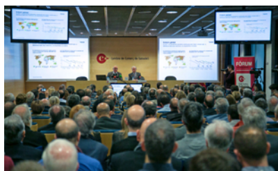
Més de 200 empresaris en la conferència d'Oliu a la Cambra de Comerç de Sabadell.

El president de Banc Sabadell, Josep Oliu, va presentar al gener a la Cambra de Comerç de Sabadell la seva visió del present exercici en una conferència titulada “Perspectives econòmiques 2017”. Davant l'assistència de més de 200 empresaris, va assenyalar que, en línies generals, les previsions són millors que les d'anys anteriors, tot i que va precisar que “el creixement global seguirà sent reduït, però per primera vegada des que va esclatar la crisi no sorprendrà a la baixa”. Sobre l'economia espanyola, el pre-