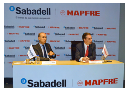
Directius de Mapfre i Banc Sabadell, presentant l'acord a Mèxic.

Banc Sabadell i Mapfre van signar al novembre passat una aliança a Mèxic per oferir serveis financers i de protecció integral mitjançant la venda d'assegurances i d'aquells serveis dirigits als clients de l'entitat. L'objectiu d'aquesta aliança és proporcionar protecció integral a través de plans de finançament i cobertura d'assegurances d'acord amb les necessitats de cada client.