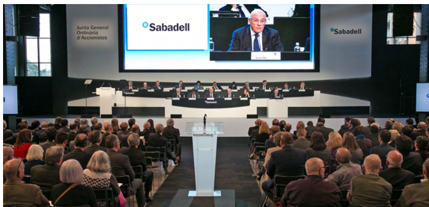
Imatge de la celebració de la Junta General d'Accionistes que va tenir lloc a Sabadell.

La Junta General d'Accionistes del banc va aprovar el passat 30 de març la gestió i els resultats de l'exercici 2016, que va tancar amb uns resultats nets de 710,4 milions d'euros, i va acordar destinar 279,7 milions d'euros a la retribució a l'accionista (0,05 euros per títol).