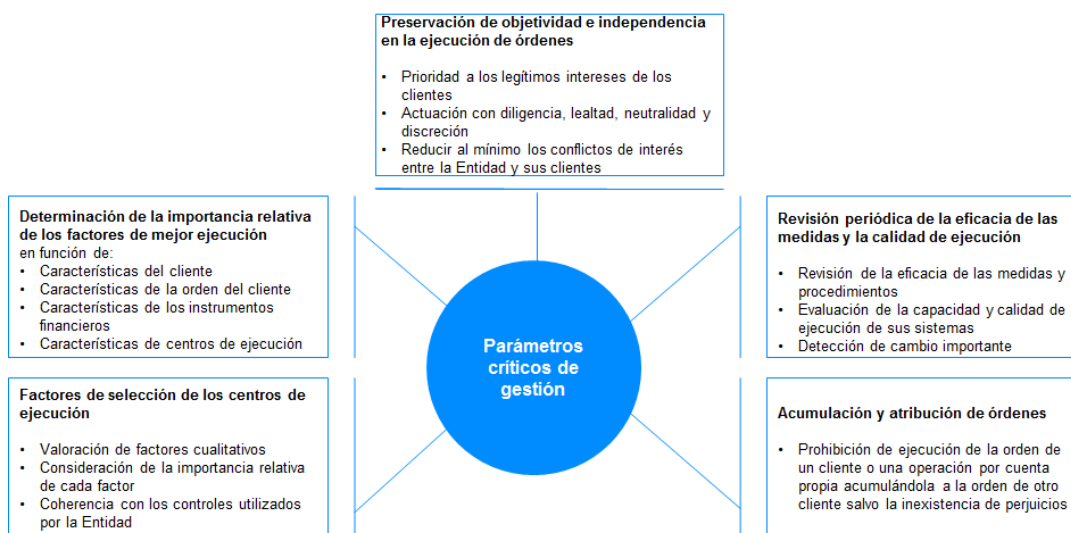
Figura 2. Parámetros críticos de gestión para la ejecución y gestión de órdenes

La figura que se presenta a continuación recoge los parámetros críticos de gestión para la POLÍTICA DE EJECUCIÓN Y GESTIÓN DE ÓRDENES: