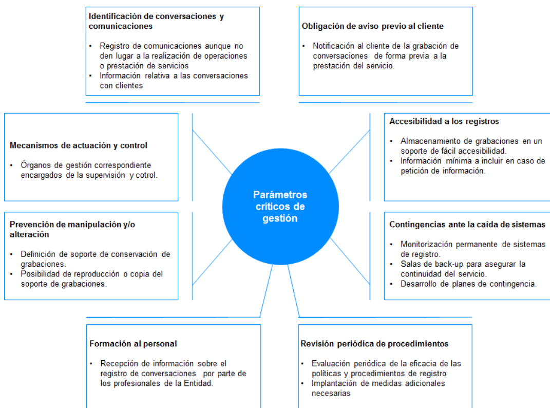
Figura 2. Parámetros críticos de gestión para el registro de comunicaciones con clientes

La figura que se presenta a continuación recoge los parámetros críticos de gestión para la POLÍTICA DE REGISTRO DE COMUNICACIONES CON CLIENTES EN EL MARCO DE LA PRESTACIÓN DE SERVICIOS DE INVERSIÓN: