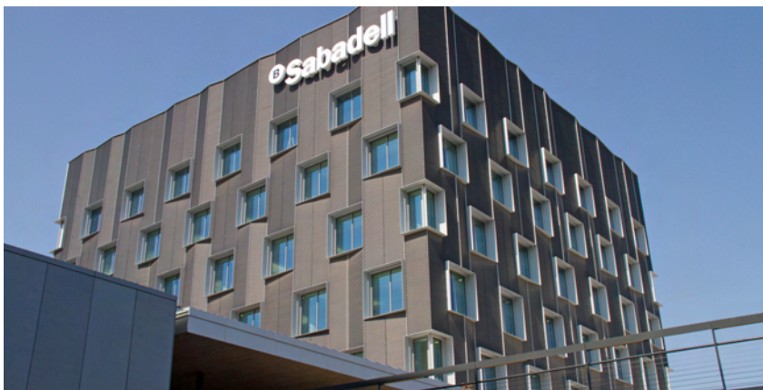
Imatge d'un dels edificis del centre corporatiu a Sant Cugat.

L'agència de qualificació Standard & Poor's (S&P) va pujar a finals de juny la qualificació creditícia de Banc Sabadell a llarg termini a BBB-, abans BB+, i a curt termini a A-3, abans B, mantenint la perspectiva positiva. Aquesta revisió reflecteix, segons S&P, la millora de la solvència de l'entitat i el progrés en l'evacuació de riscos en el seu balanç. L'agència també va incrementar el ràting del deute subordinat i de les accions preferents de Banc Sabadell en dos esglaons, situant-lo en BB i B, respectivament.