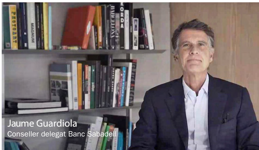
La presentació de resultats es va celebrar de manera telemàtica.