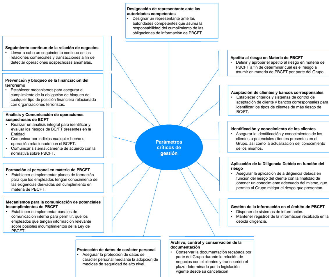
Figura 2. Parámetros críticos de gestión para la Prevención de Blanqueo de Capitales y de la Financiación del Terrorismo

La figura que se presenta a continuación recoge los parámetros críticos de gestión para la POLÍTICA DE PREVENCIÓN DE BLANQUEO DE CAPITAL Y FINANCIACIÓN DEL TERRORISMO, siempre en función de su actividad y territorialidad y aplicando el criterio de proporcionalidad: